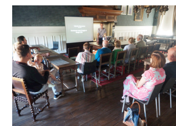
Boven: Een exclusieve nocturne in het gemeentehuis voor de reward van €500