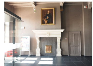
Boven: Het gerestaureerde portret van Raoux van de hand van Valentin Henneman prijkt nu op de schouw in het gemeentehuis in Oostkamp